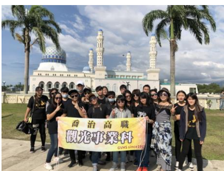
水上清真寺大合影