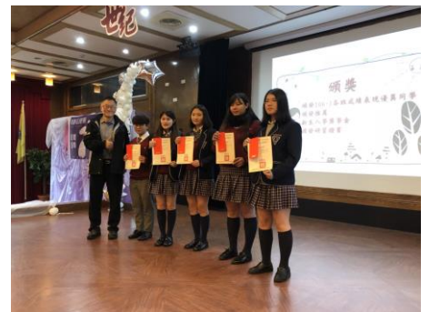
觀光科優秀孩子們