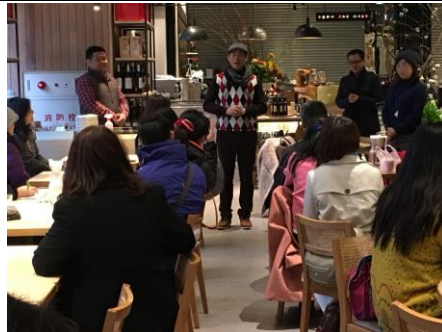
教師研習開訓儀式～