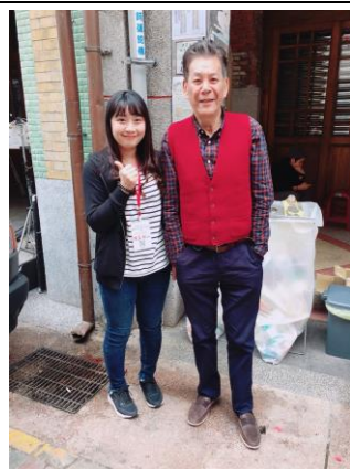
巧遇大明星-龍劭華先生