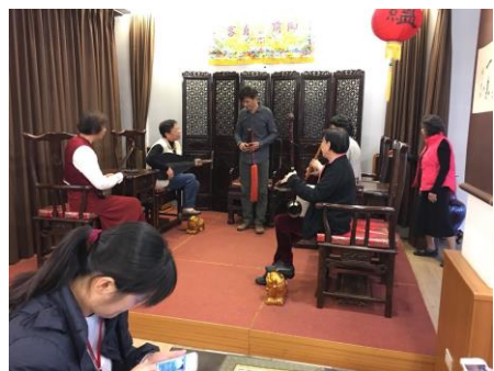
御前清客，南管，品茗