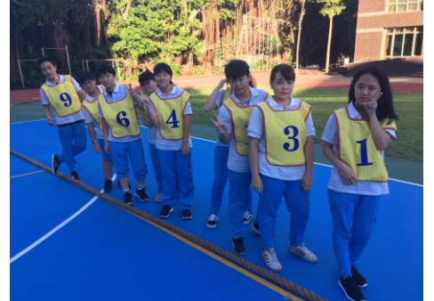
女子組 8女+1男小將們