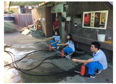
消防標靶射水體驗