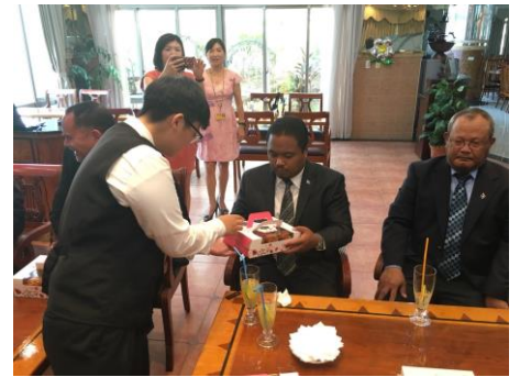
贈送餐飲管理科製作手工禮盒