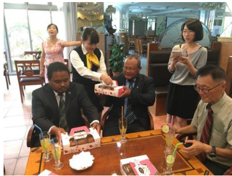
贈送餐飲管理科製作手工禮盒