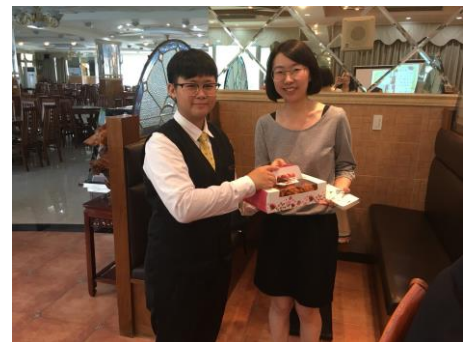
贈送餐飲管理科製作手工禮盒