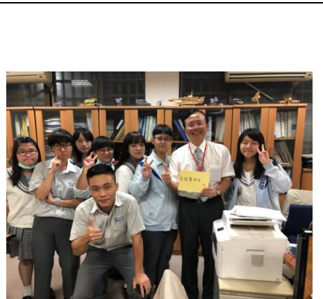
二溫贈送校長教師節卡片