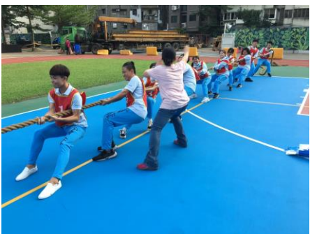
一溫爆發力十足/老師賣力應援