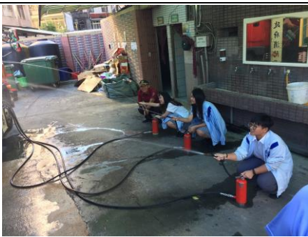
消防標靶射水體驗