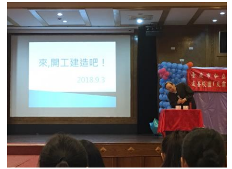
來, 開工建造吧! 講座