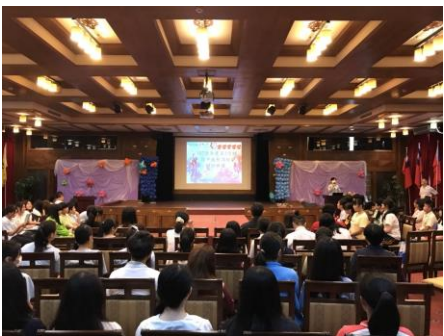
台灣國家公園之美