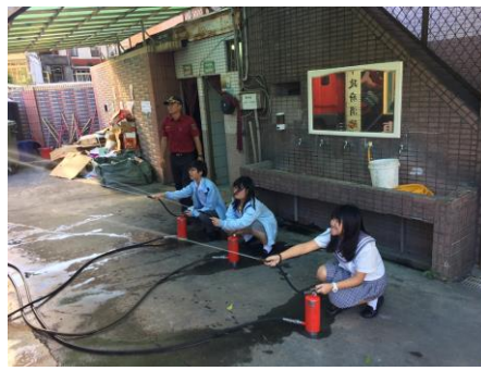
消防標靶射水體驗