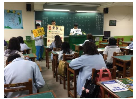
二溫優良學生政見發表