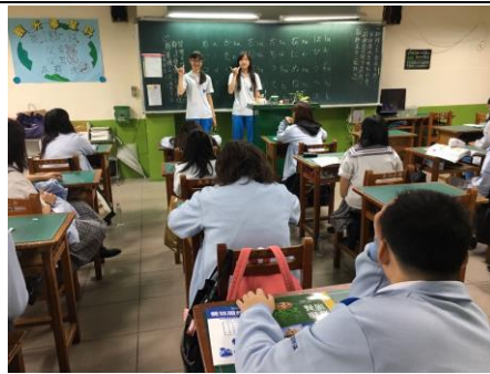
三愛優良學生政見發表