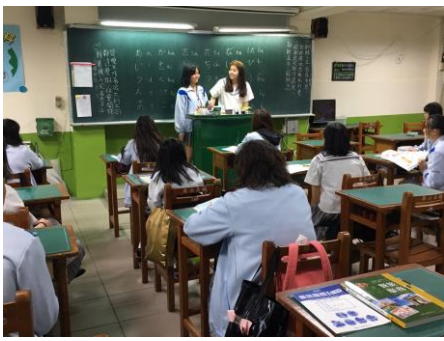
二文優良學生政見發表