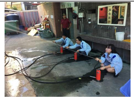
消防標靶射水體驗