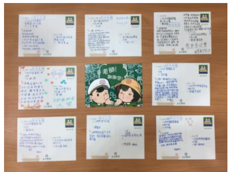
學生撰寫敬師明信片給國中教師