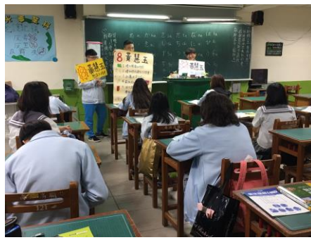
二溫優良學生政見發表