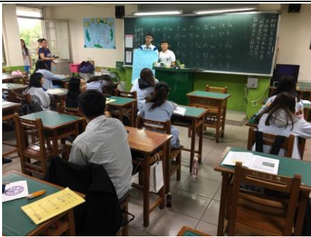
二智優良學生政見發表