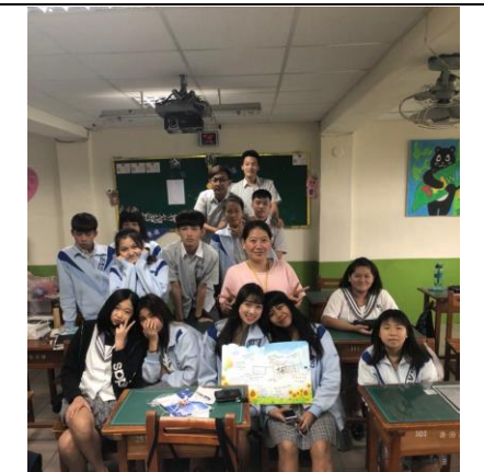
一溫贈送導師教師節卡片