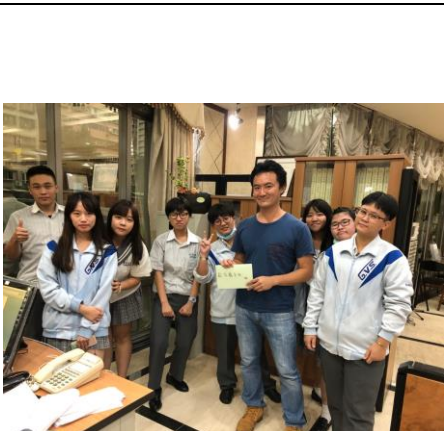
二溫贈送教務主任教師節卡片