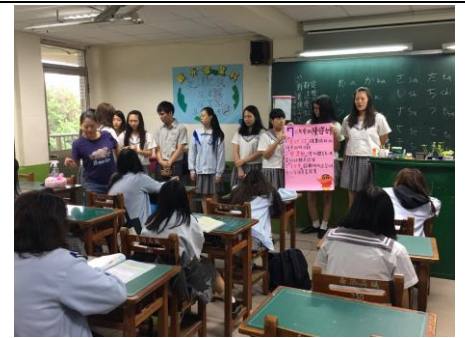
二愛優良學生政見發表